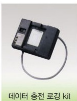
데이터 충전 로깅 kit