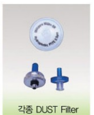
각종 DUST Filter