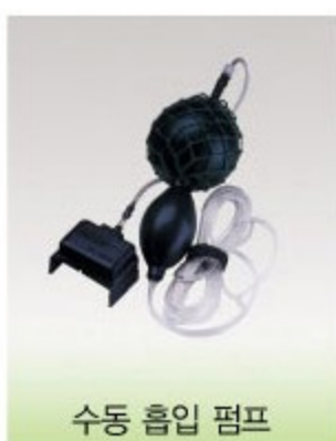
수동 흡입 펌프