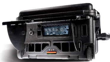
커버를 통해 필요 케이블과 호스를 간편하게 연결 가능