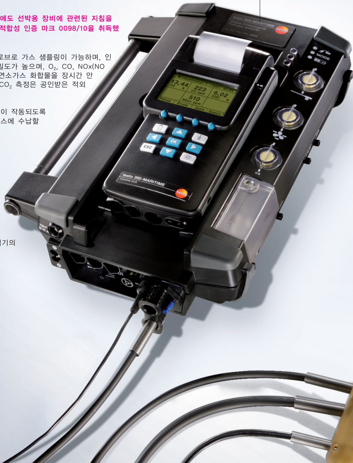
testo 350-MARITIME 연소가스 분석기