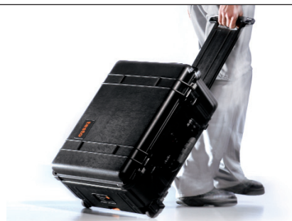
견고한 트롤리 운반 케이스